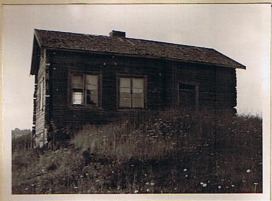
Elfwingska släktgården i Älvsöden