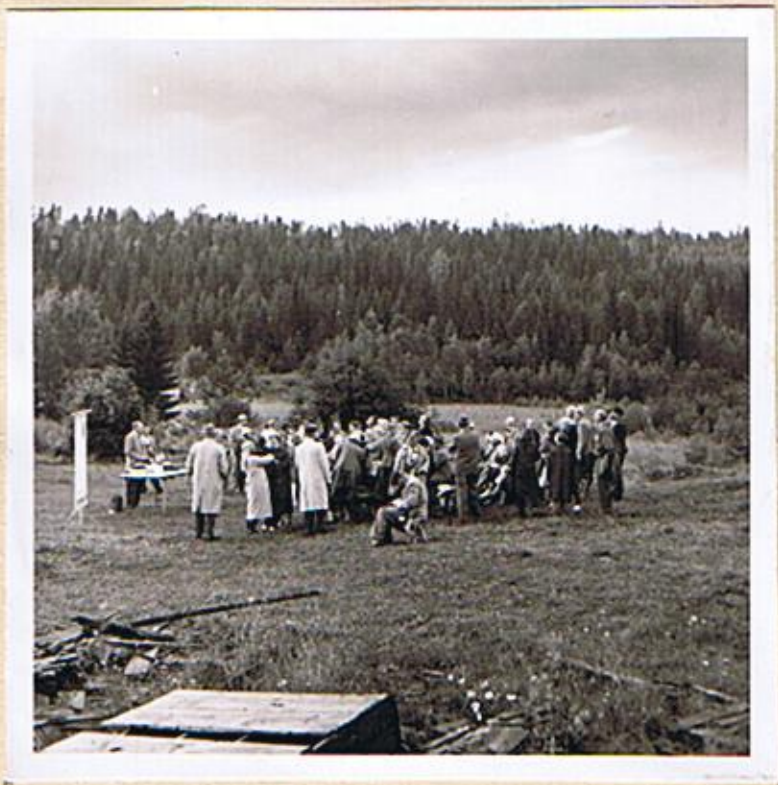
Varje deltagare i släktmötet fick en träsked som minne